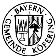
Armin Dirschl Erster Bürgermeister