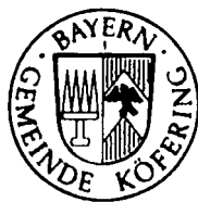
Armin Dirschl Erster Bürgermeister